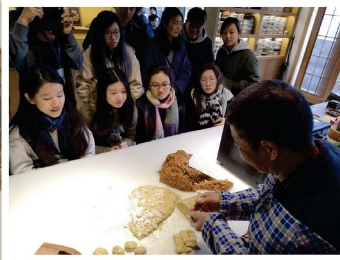
現場教學、體驗製作腐乳餅