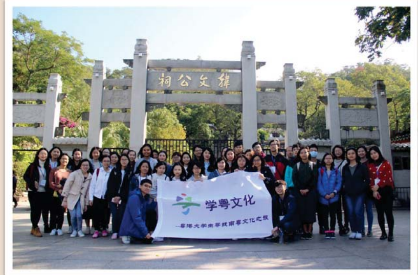
韓文公祠合影留念