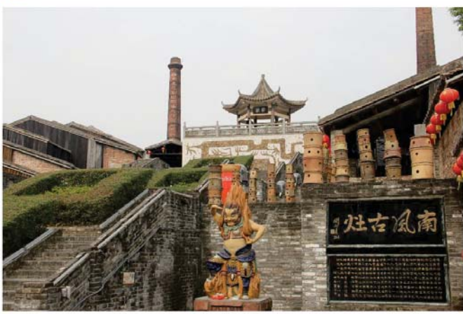
南風古灶燒制陶器