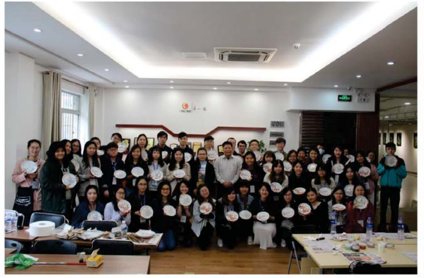
廣彩製作合影留念